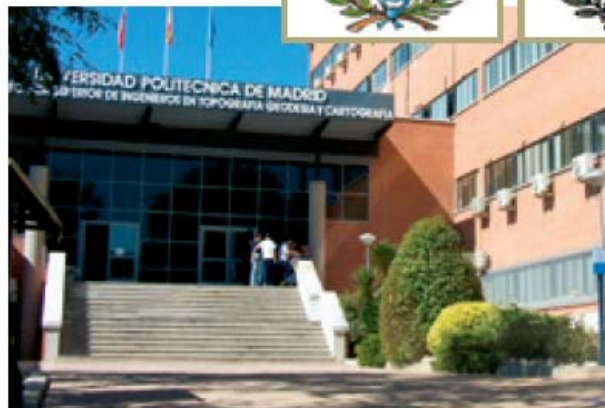
E.T.S.I. en Topografía, Geodesia y Cartografía Fachada principal y escudo